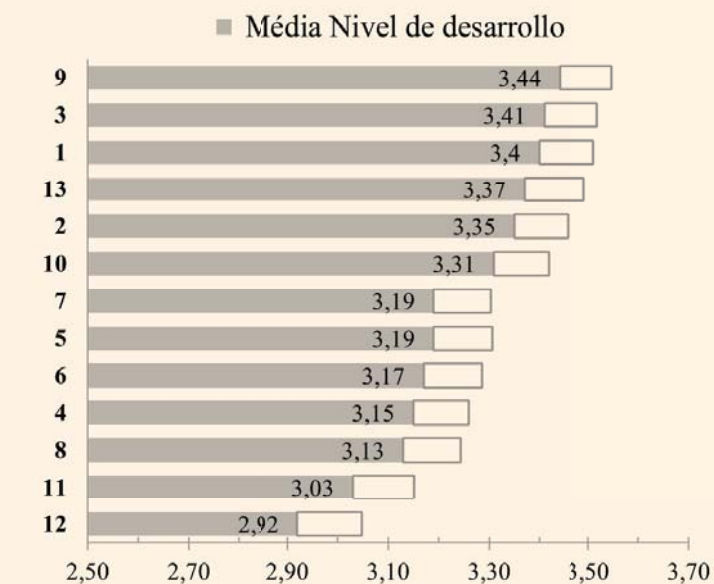
FIGURA 1 COMPETENCIAS ORDENADAS DE MAYOR A MENOR MEDIA

Puntuaciones obtenidas en la escala Likert