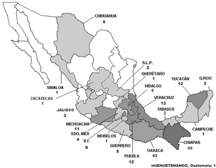
MAPA 1 BECARIOS. ESTADOS DE ORIGEN